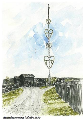
Majstångsremning i Hedby 1930

Årgång 8 Nummer 1, 2016-06-20 HEDBYBLADET Delas ut till alla hushåll i Hedby, Höbby och Kanngårdarna